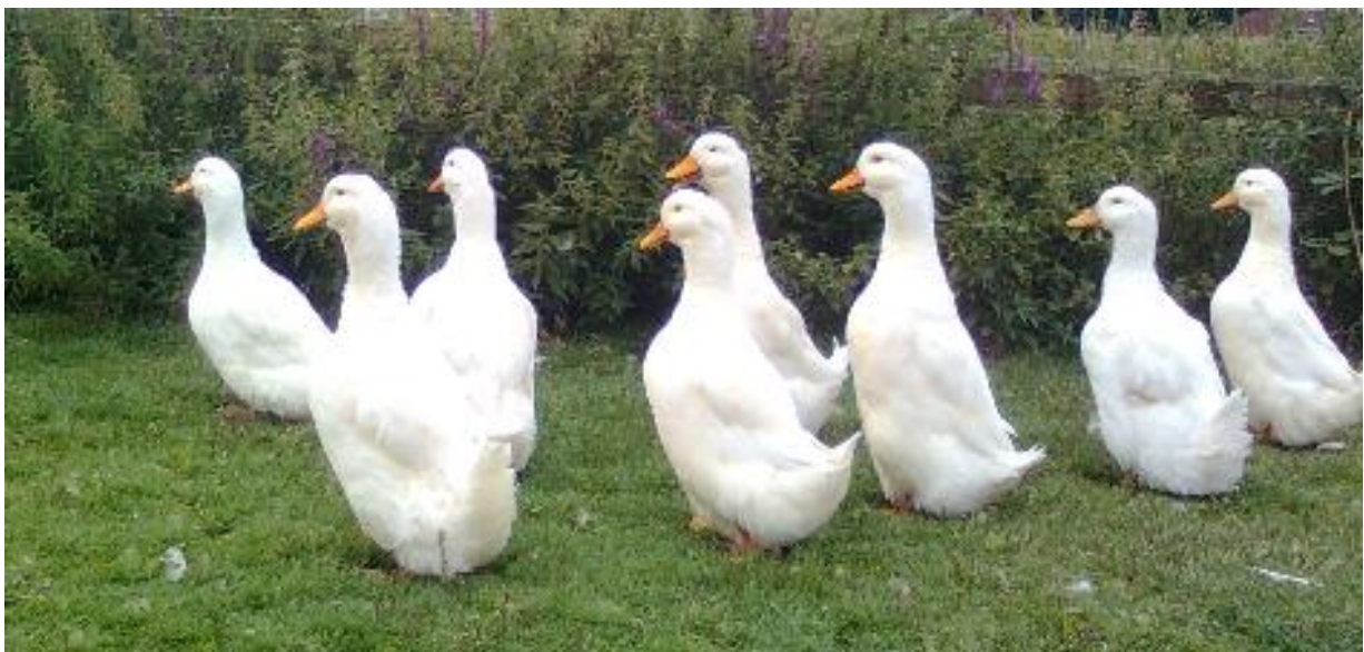
Tyske Peking Ænder