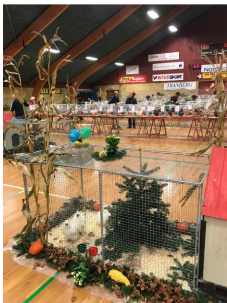
Fra udstillingen i Tullebøllehallen 2017